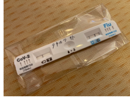
2024.1 インフルエンザA型に罹患してしまいました