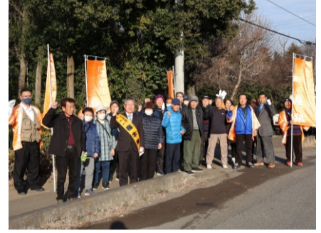
2024.1 守谷市議選 同志の応援に参加