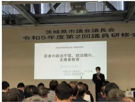
2024.2 茨城県市議会議長会 議員研修会（結城市で開催）