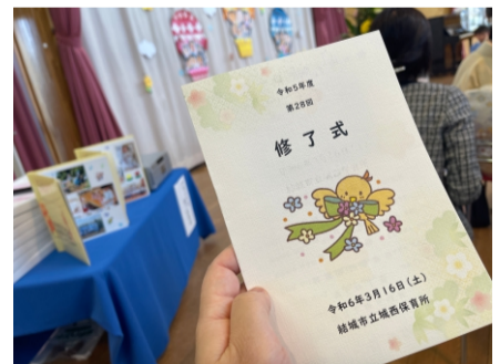
2024.3 城西保育所 終了式 友達をたくさん作ってね！