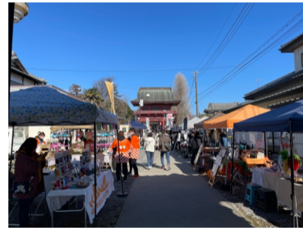
2024.2 ヤマカワフェス 参加 地域の活力を肌で感じる