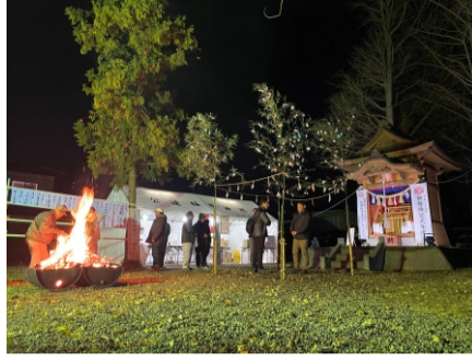
2024.1 地元稲荷神社で地元の皆さんと年越し