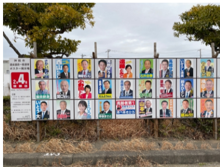
2024.2 神栖市議選 同志の応援に参加