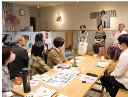
2024.3 街おこしの活動を視察（真岡市）