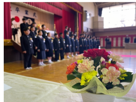
2024.3 城西小学校 卒業式 中学校でも益々ご活躍を！