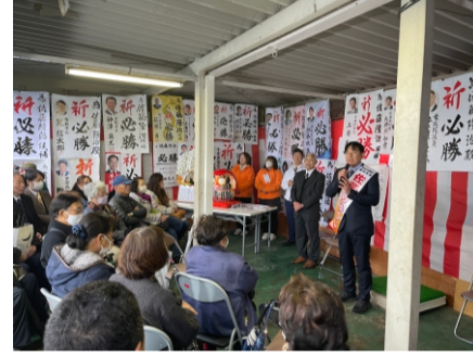
2024.1 取手市議選 同志の応援に参加