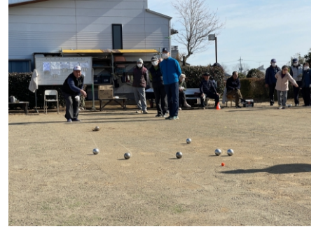
2024.1 結城ペタンク協会交流会に参加