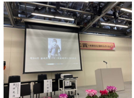
2024.2 新川和江 賞 未来を拓く詩のコンクール