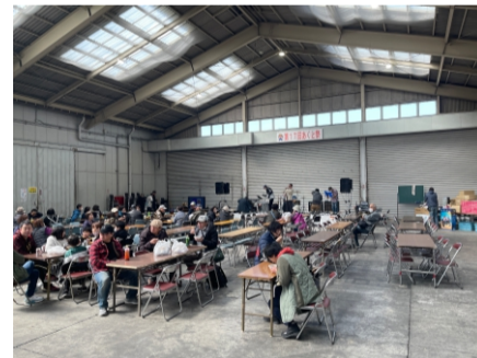
2024.3 あくと祭り 参加 4年ぶりの開催で賑わい復活