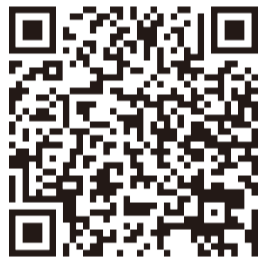
茨城県教育委員会HP 公立小・中学校等の適正規模・適正配置

これまで17年、結城市議会議員として活動してきたなかで、市施工 結城南部土地区画整理事業、組合施工 北西部区画整理 3組合への税金投入（借入金の返済支援）による負担の軽減、しるくろーど3階 購入による救済（実際には管理会社の固定資産税 滞納相当額と推測される金額での物納による取得）（私は購入に反対しました）等、大型事業を見てまいりました。北西部・結城南部の区画整理という大きなインフラ投資がひと段落してきたことから、これからは、南に目を向け、南部地域の振興にも取り組んでいく時期と考えます。