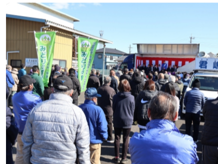
2024.2 那珂市議選 同志の応援に参加