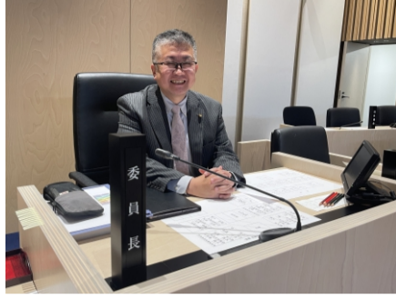
予算特別委員会にて委員長を拝命し進行を仰せつかりました

年度が明けて、新しい体制での活動がスタートされたかと思えます。令和6年度も、皆さんと一緒に、様々な課題に元気に取り組んでまいりたいと思えます。