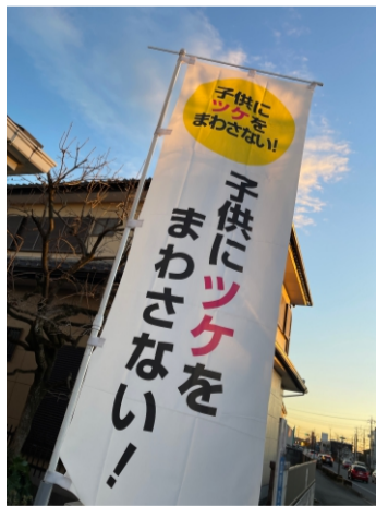
子供にツケをまわさない 私も所属している日本税制改革協議会の理念です