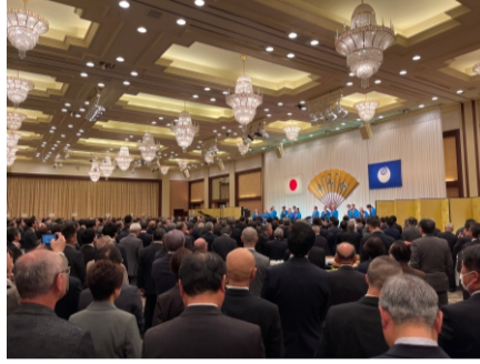
2024.1 千鳥会 県内最大の賀詞交歓会に参加