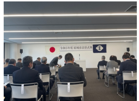
2024.3 結城市表彰式典 活躍された皆さんに感謝