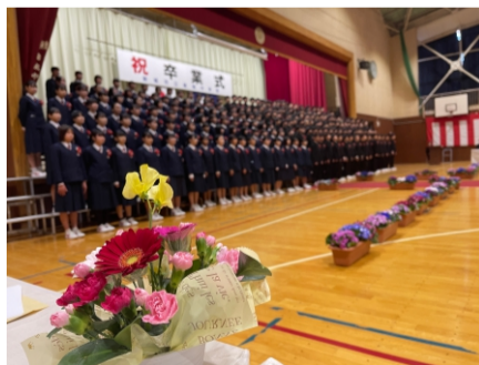
2024.3 結城中学校 卒業式 未来に向かって元気に！